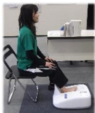
体組成測定 & 骨密度測定