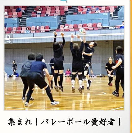
集まれ！バレーボール愛好者！