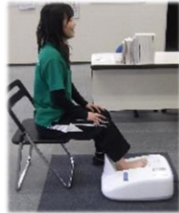
体組成測定 & 骨密度測定