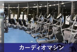
カーディオマシン