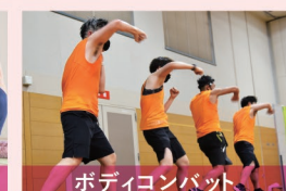
ボディコンバット